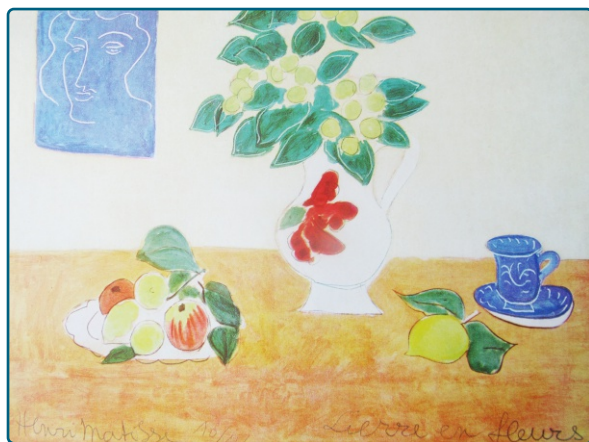
Henri Matisse Le lierre en fleurs - lithographie originale - 1941 Collection privée

Cette cinquième édition de Traces d'Artistes et Courants d'Art s'inscrit dans un cycle d'expositions consacrées aux arts plastiques et visuels de 1950 à nos jours. La formule a rencontré un vif intérêt en France et en Belgique.